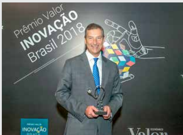
O Presidente Executivo do Bradesco, Octavio de Lazari Junior, recebe o prêmio

O Bradesco foi o primeiro colocado na categoria Bancos no anuário Valor Inovação Brasil 2018 , levantamento feito pelo jornal Valor Econômico em parceria com a Strategy&, consultoria estratégica da PwC. No ranking geral, que inclui todas as categorias e 150 empresas, o Banco figurou entre as dez mais inovadoras. A pesquisa, que está na quarta edição, analisou empresas de 21 setores segundo critérios como intenção de inovar, esforço para efetivar a inovação, resultados obtidos, avaliação do mercado e publicação de patentes. Em relação ao Bradesco, o anuário